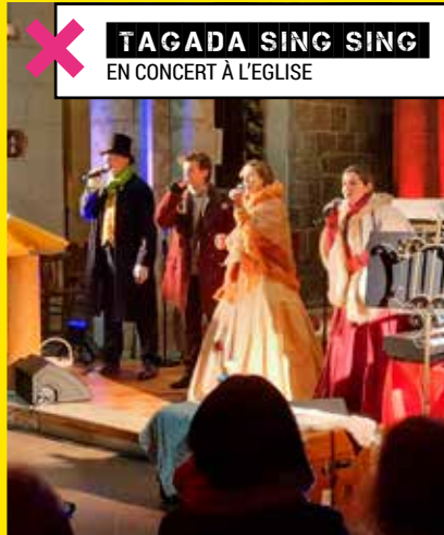
✕ TAGADA SING SING EN CONCERT À L'ÉGLISE