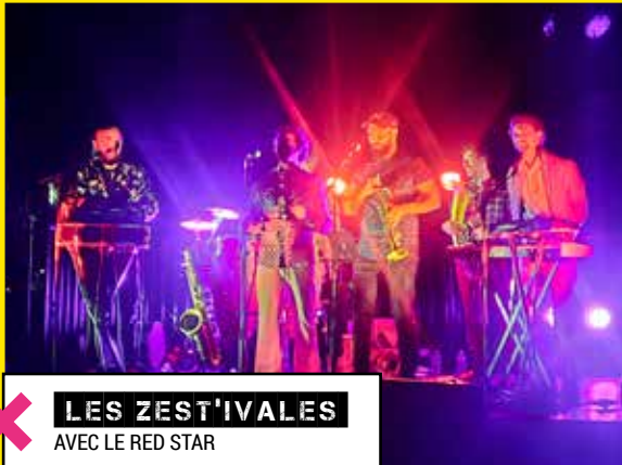
✕ LES ZEST'IVALES AVEC LE RED STAR