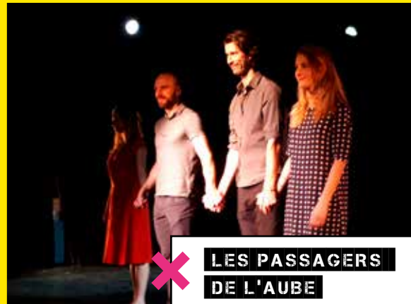
✕ LES PASSAGERS DE L'AUBE