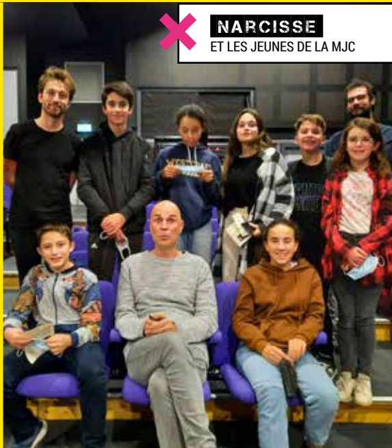
✕ NARCISSE ET LES JEUNES DE LA MJC