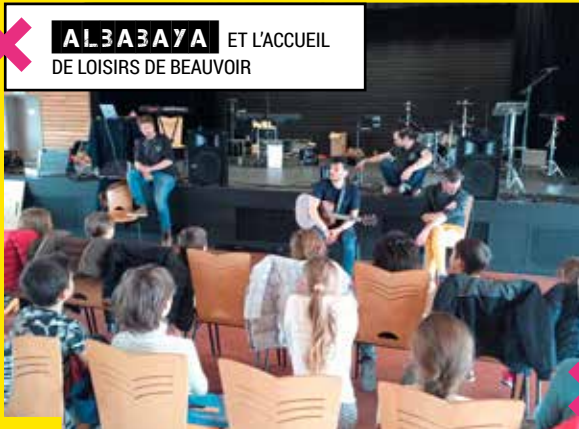
✕ ALBAZAYA ET L'ACCUEIL DE LOISIRS DE BEAUVOIR